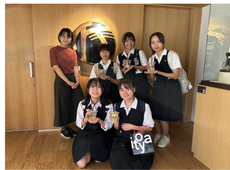
▲班ごとに企業訪問をする

28日には、班ごとに分かれて企業訪問を行った。3か月以上前から揺籃の時間で準備を行い、興味のある企業に自分たちでアポイントを取って訪問した。日々変化する社会の中で、各企業が様々な取り組みを行っていることを知り、将来の自分をイメージする良い機会となった。