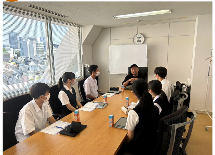
▲企業へのインタビューを行う

最終日の29日には、HRの班ごとに、渋谷や東京駅、東京スカイツリーなど、都内の各所を散策した。計画や行動を共にすることで、仲間との絆はより深まった。