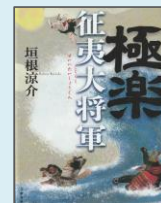
『極楽征夷大将軍』(文藝春秋) 垣根 涼介／著

やる気なし使命感なし執着なし。なぜ天下を獲れたのか？幕府の祖でありながら、謎に包まれた初代将軍・足利尊氏の秘密を解き明かす歴史群像劇。