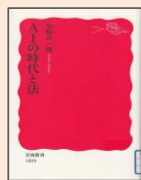
『AIの時代と法』 小塚 莊一郎／著