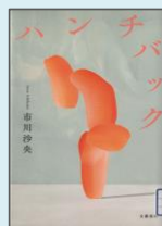
『ハンチバック』(文藝春秋) 市川 沙央／著

難病の重度障害者を主人公にした、健常者や多様性の意味を問われる。衝撃を与えた文学界新人賞受賞作。