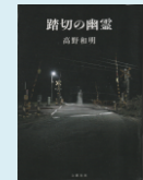
『踏切の幽霊』 高野和明

第169回 芥川賞・直木賞受賞作が7月19日に発表されます。受賞作品は順次配架予定です。お楽しみに。現在、図書館には直木賞候補の2作品が配架されています。