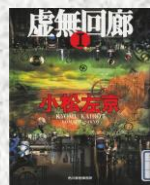
『虚無回廊』小松左京