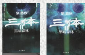
『三体 黑暗森林 上・下』