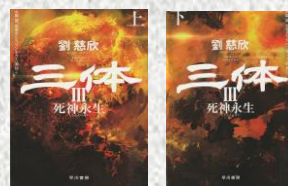
『三体 死神永生 上・下』