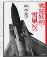
『戦闘妖精雪風』神林長平